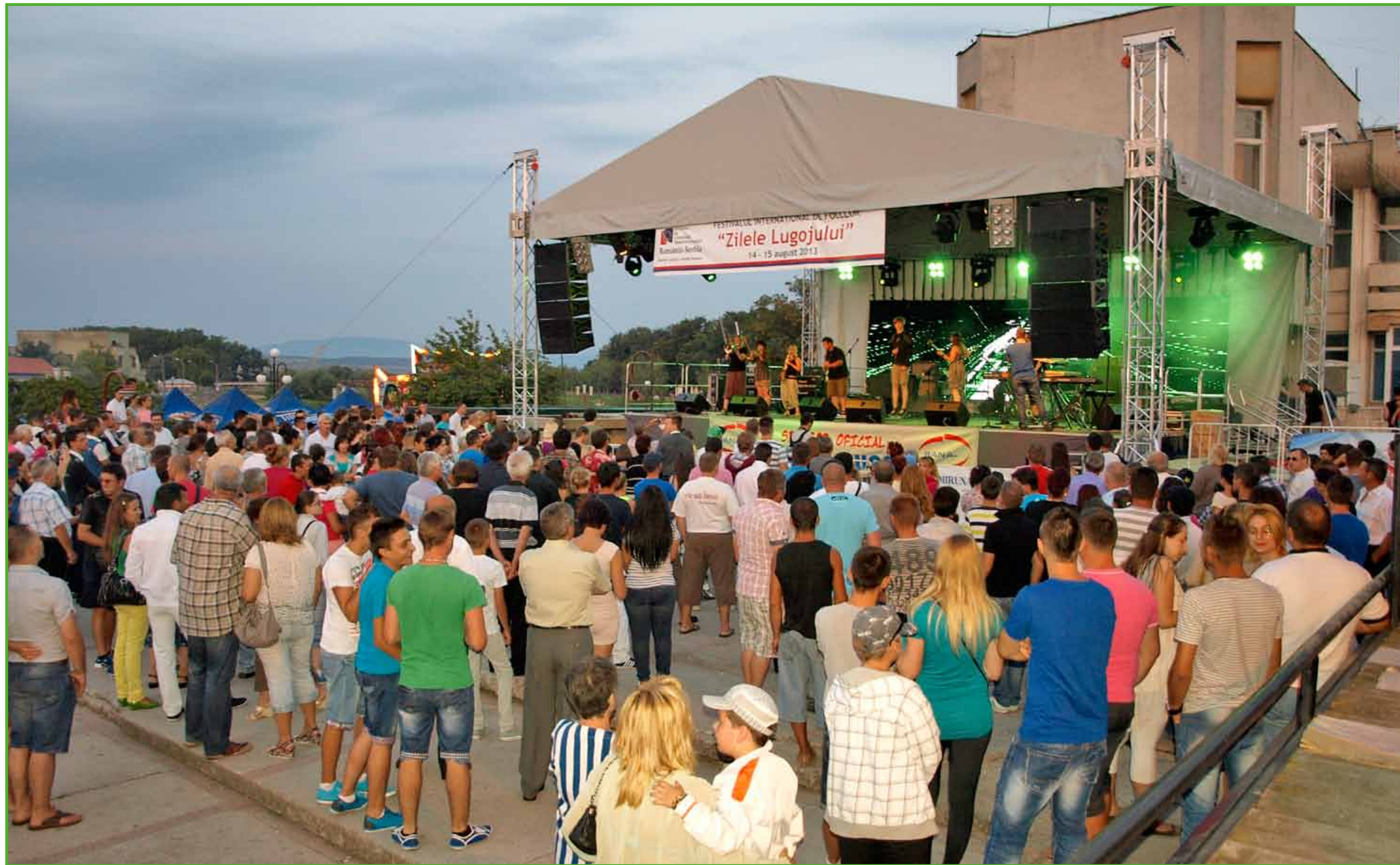
Auftritt der Band Bjelomore in Lugoj

Auch der Fanclub des FCC war mit seiner Street-Soccer-Anlage schon in Lugoj.